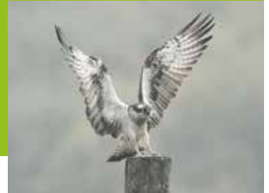
De visarend Pagina 13