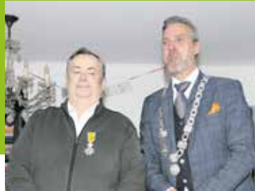
Lintjesregen Pagina 8-10