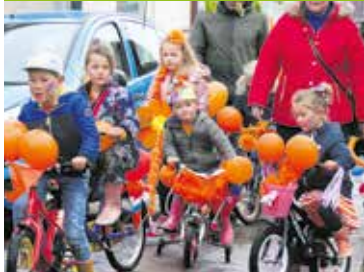
Een geslaagde Koningsdag Pagina 6-7