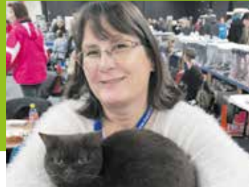
Fijnaart interview Pagina 12