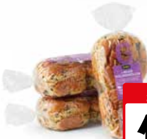
Reuze rozijnenbollen Zak 4 stuks