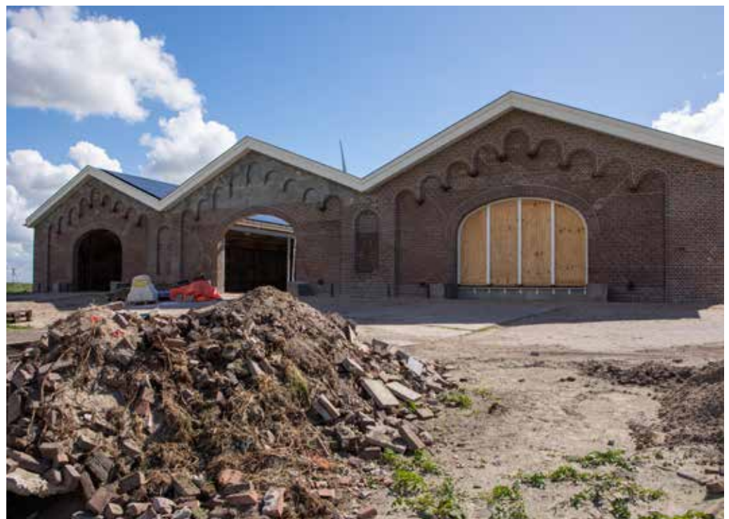
De restauratie van de botenloods is rond 21 mei afgerond.

De nieuwe verdedigingstactiek bracht ook meer militairen naar Fort Sabina. “Rond het begin van de 20e eeuw waren hier 540