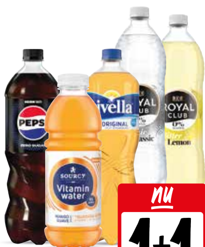
Pepsi, Royal Club, Rivella of Sourcy Alle flessen à 1 liter

NU IN DE AANBIEDING • NU IN DE AANBIEDING • NU IN DE AANBIEDING