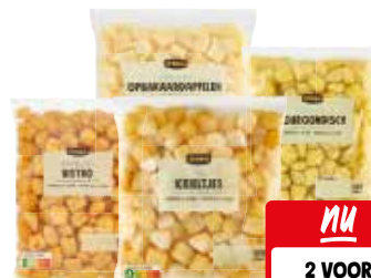
Jumbo minikrieltjes, aardappelpartjes of opbakaardappelen Alle zakken à 600 gram