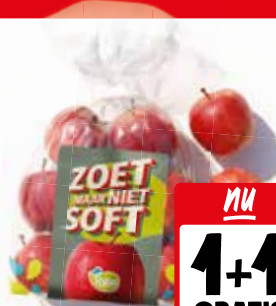
Tessa appels Zak 1 kilo