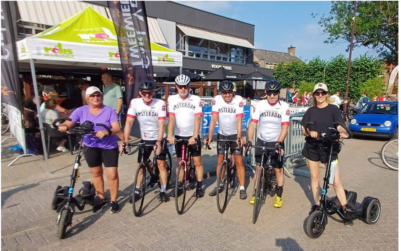
Enkele sportieve deelnemers tijdens de Fietsvierdaagse 2025

Het duurt nog even, maar de klok is inmiddels verzet naar de zomertijd en dat betekent dat het bij velen alweer begint te kriebelen om deel te nemen aan de Fijnaartse Fietsvierdaagse. Van dinsdag 16 tot en met vrijdag 19 juni 2026 staat Fijnaart weer in het teken van de leukste sportieve traditie van het jaar! WielerToerClub Heij=Fijn organiseert dit evenement voor de achtste keer en nodigt jong en oud uit om te genieten van de prachtige West-Brabantse polders.