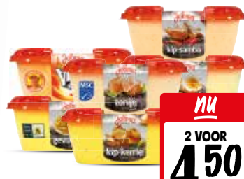
Johma salades Alle bakjes à 175 gram