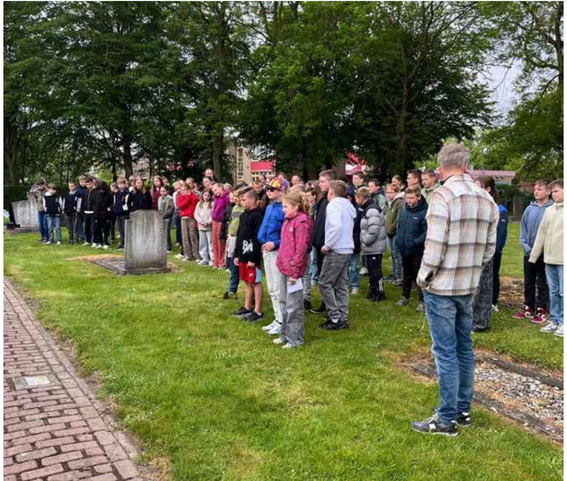
Alle kinderen die aanwezig waren tijdens de herdenking

Ook dit jaar werd de scholenherdenking weer georganiseerd door het Oranje Comité Heijningen. Met een goede opkomst van bijna 80 leerlingen, is het duidelijk te zien waarom de organisatie dit doet. Het is belangrijk om te blijven herdenken, zodat de slachtoffers niet vergeten worden.