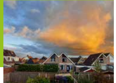
Fijnaart in Beeld