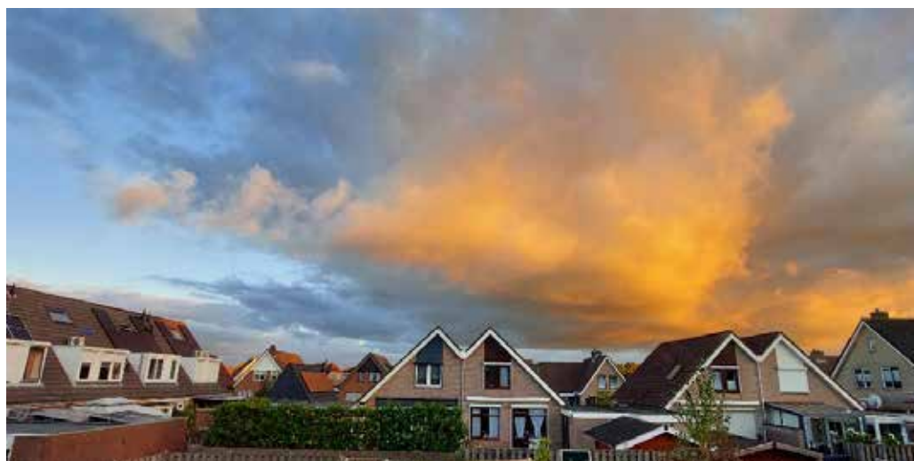
Mooie lucht boven Fijnaart - A.J. Kroon