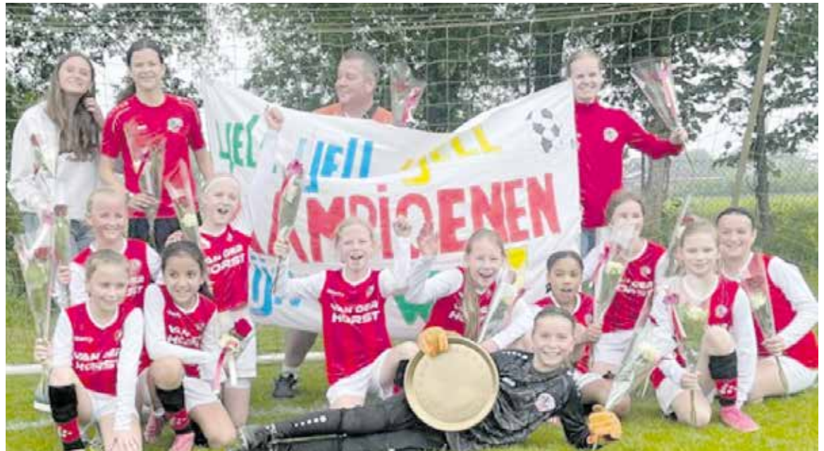
v.v. de Fendert MO11 kampioen

Een peptalk in de rust hielp om de zenuwen weg te nemen en in no-time was de achterstand weggepoetst. Eindstand 2-5. Het feest kon beginnen. Bloemeshop Marloes had voor iedereen een bloemetje geregeld. Bedankt voor deze sponsoring! Ouders hadden gezorgd voor een kampioensschaal, spandoek, fakkels en ook de kinderchampagne mocht niet ontbreken. Uiteraard werd de route naar het sportpark verlengd met een ereronde door de Fendert. Een kolonne van 12 toeterende auto's voorzien