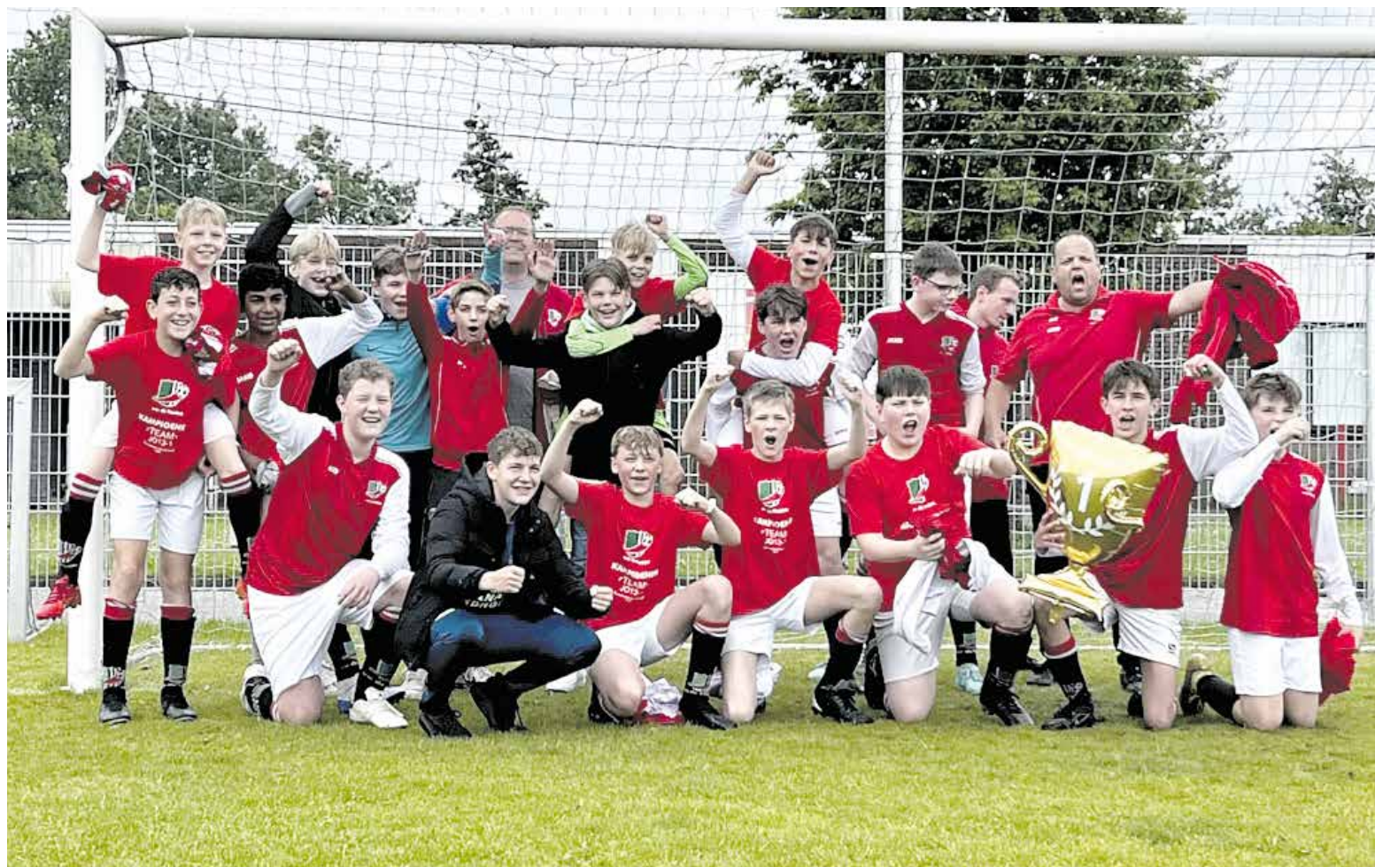
De kampioenen van VV De Fendert JO13-1