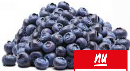
Blauwe bessen Bak 300 gram

NU IN DE AANBIEDING • NU IN DE AANBIEDING • NU IN DE AANBIEDING