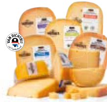
Alle Wapenaer 48+ kaas stukken M.u.v. Brokkelschuitje