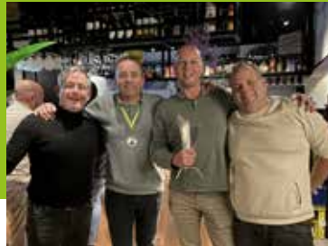
Fendertsman van het jaar