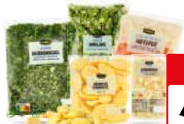
Jumbo stampotgroente of aardappelen Boerenkool zak 300 gram, andijvie zak 400 gram, hutsput zak of zuurkool schaal 500 gram of stampot aardappelen zak 600 gram