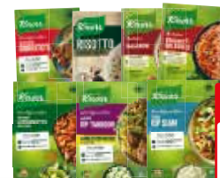
Knorr wereldgerechten, maaltijdmixen, spaghetteria's of risotteria's