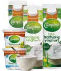
Campina kwark of yoghurt Alle bekertjes à 225 of 500 gram of pakken à 1 liter