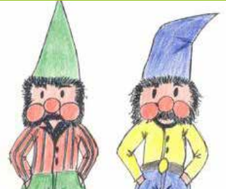
Polleke en Pelleke