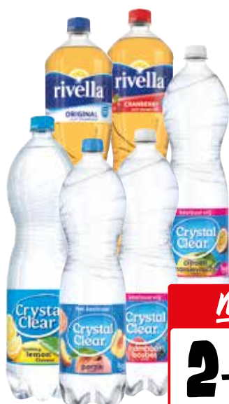
Crystal Clear of Rivella Alle flessen à 1,5 liter

NU IN DE AANBIEDING • NU IN DE AANBIEDING • NU IN DE AANBIEDING