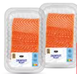
Zalmfilet Schaal à 360 gram