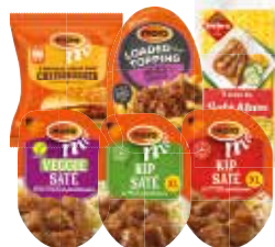
Alle Hebro of Mora saté, loaded toppings, loempia of snackbroodjes