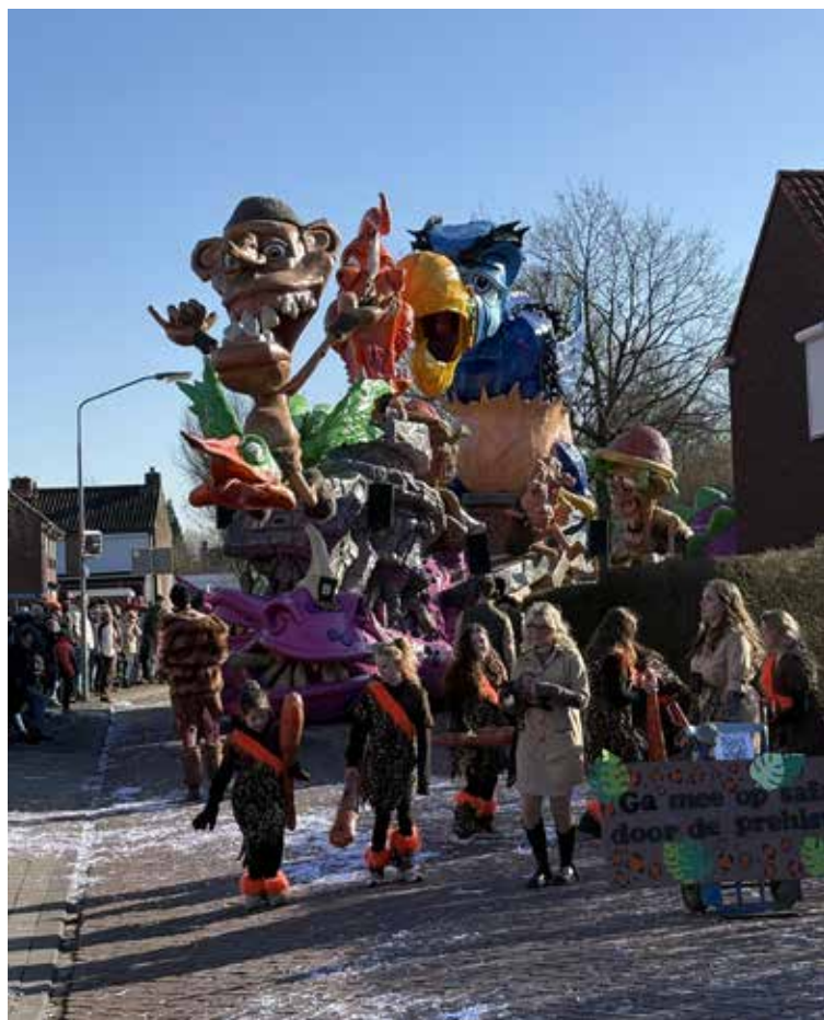
B.C. Dun Deurzetters

15 februari ut Puitenol (Oudenbosch). De ochtend begon met een prachtig zonnetje tijdens het opbouwen. We waren die dag ook prinsenvagen in het mooie Puitenol. Toen om 14:00 uur de optocht begon werd de lucht al een beetje grijs en het werd een stuk kouder en ja, precies dat we ongeveer over de helft waren van de optocht, begon het te sneeuwen maar het leverde