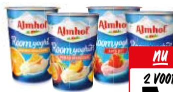
Almhol yoghurt Alle bekertjes à 500 gram