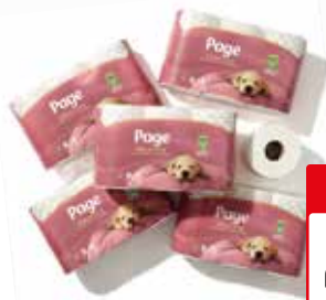
Page sensitive toilet papier Pak à 6 rollen